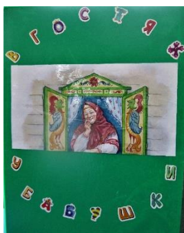
Первая страница «В гостях у бабушки»

Бабушка (дети сами придумывают имя) приглашает детей отправится в путешествие по миру фольклора.