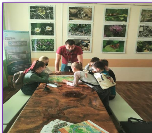
выставочный комплекс «Жигулёвская мозаика»

Туризм и краеведение имеют комплексный, интегративный характер воздействия на личность и коллектив.