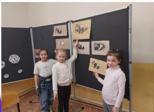
Техника работы с углем.

В ходе обучения по программе обучающиеся принимают активное участие в различных конкурсах городского, окружного, областного, всероссийского и даже международного уровня и становятся победителями, призёрами конкурсных мероприятий.