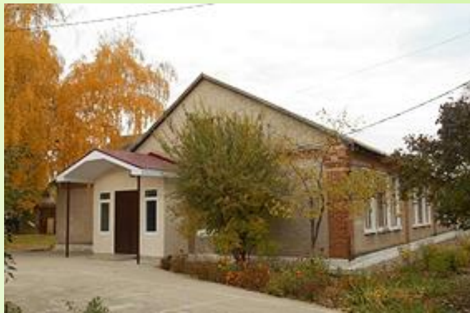
Здание СП ЦВР "Успех"

СП ЦВР «Успех» был образован в ноябре 1953 года. У него богатая история, полная ярких, значимых для детей города, событий. Она начинается с решения Городского Совета народных депутатов и его Исполнительного комитета от 02 ноября 1953г. «Об открытии Дома пионеров в городе Жигулёвске»: «Открыть в городе Жигулёвске с 3 ноября 1953г. Дом пионеров в клубе «Нефтяников» по адресу: ул. Приволжская, д. 9а.» (Архивная выписка №1176 от 07.09.04.)). С того времени Дом пионеров становится организатором и координатором всех пионерских дел города, центром воспитания вожатых, председателей советов дружин, пионеров – активистов, организации интересного досуга детворы. Становление Дома пионеров как центра работы с подрастающим поколением города проходило под руководством хороших педагогов, замечательных, увлечённых делом людей, настоящих энтузиастов, отдававших тепло своих сердец детям.