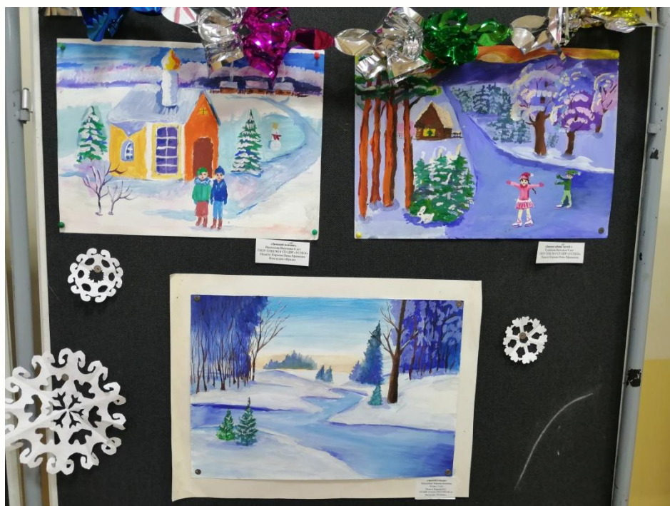
Выставка работ д/о "Краски года"(2)

Важной составляющей творческой заинтересованности обучающихся является посещение художественных выставок, проведение бесед и экскурсий с обращением детского взора на природу, красоту родного города. На своих уроках педагог использует компьютерные технологии: презентации, виртуальные экскурсии по главным художественным музеям страны. С целью развития индивидуальных качеств личности каждого ребенка Нина Ефимовна проводит коллективные творческие задания. Это позволяет сплотить детский коллектив.