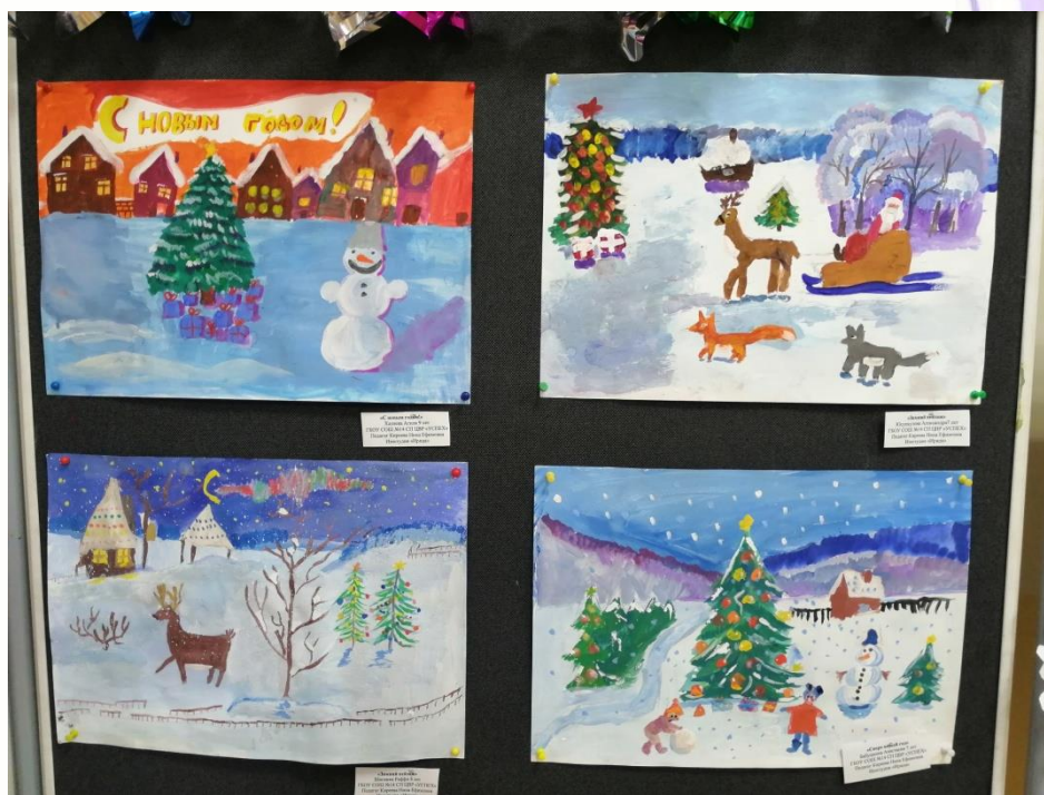
Выставка работ д/о "Краски года"(1)