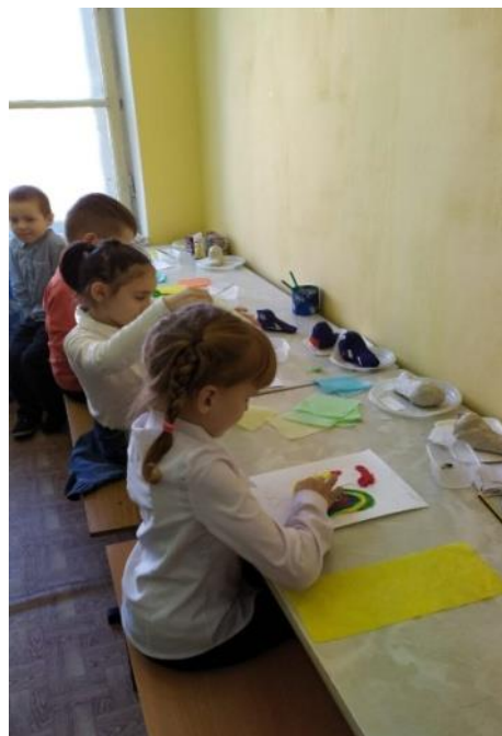
Обучающиеся д/о "Золотые ручки"

- Педагогам я советую «гореть» на своей работе, любить детей, что бы ни произошло и как бы тяжело сейчас не было. Я считаю, что профессия «Педагог» -больше чем просто работа, это призвание! А детям я советую овладевать как можно большим числом профессий, впитывать все, что только можно. Ведь никогда не знаешь, где и в чем эти знания могут вам пригодиться!