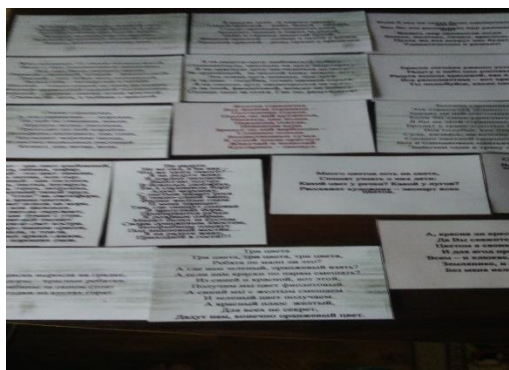
Кармашек №10 Карточки с опытами и экспериментами