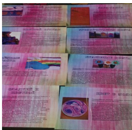
Кармашек №11 Карточки с нетрадиционным рисованием.