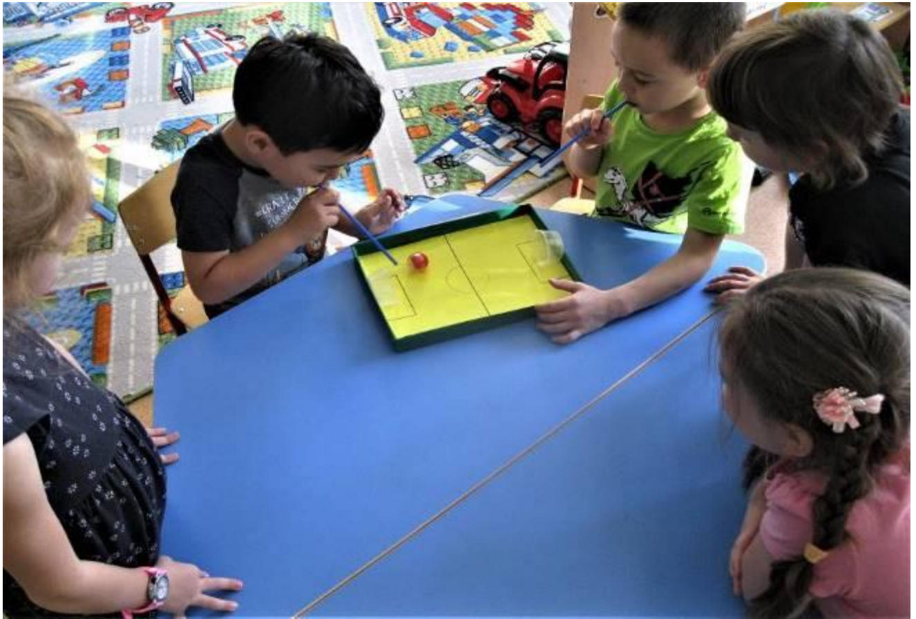
Авторское пособие лэпбук «изучаем свойства воды»