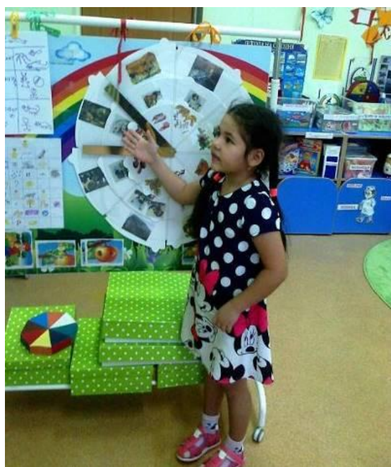
Игры, выполненные воспитателем