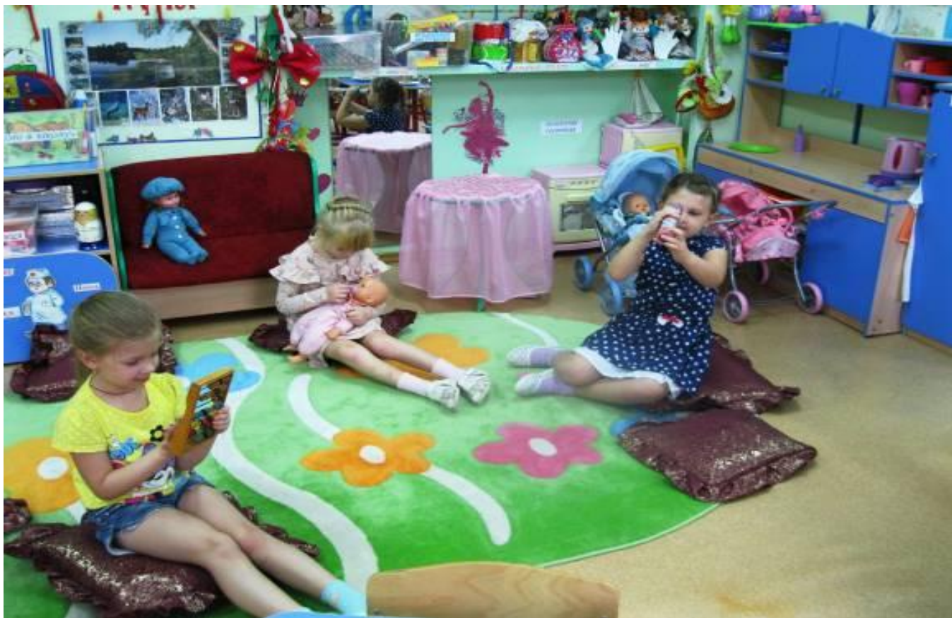
"Отдохнём на полянке"