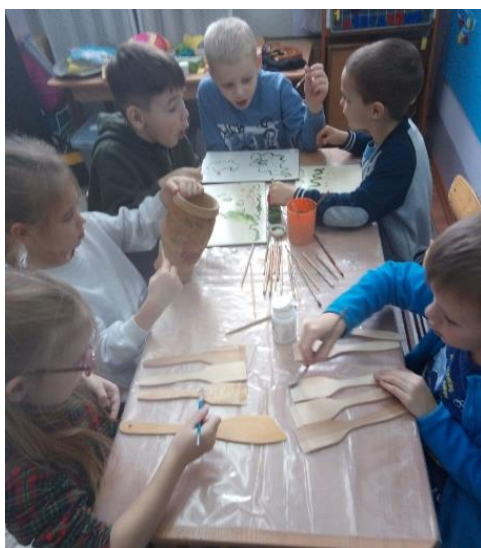
Работа с тренировочными досками и предварительная обработка лопаток перед росписью