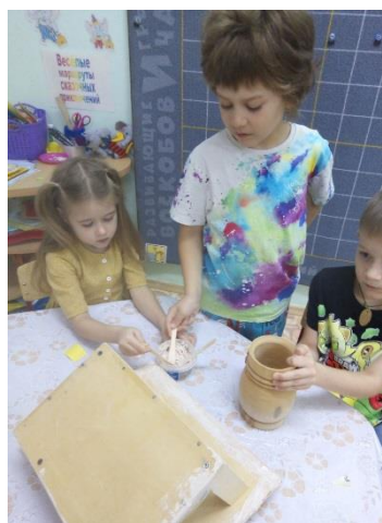
Работа со шпатлевкой